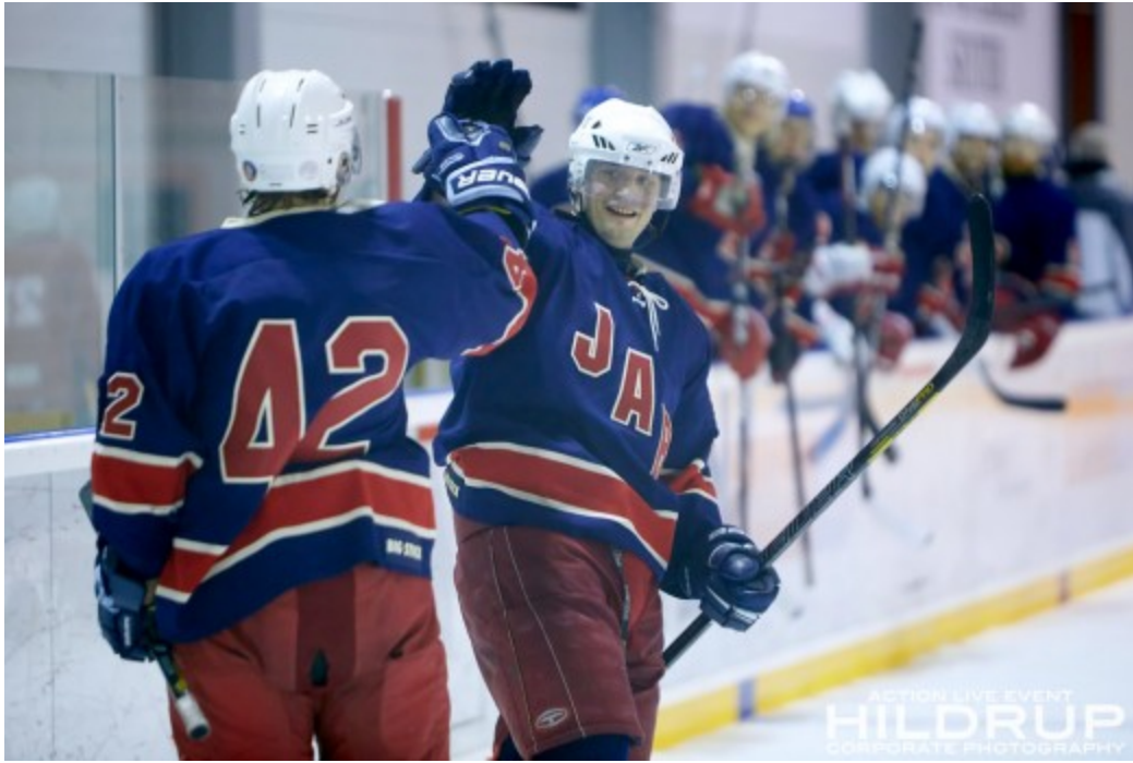
Jar IL ishockey er i dag en definert breddeklubb - Jar's A-lag spiller i 3.divisjon.