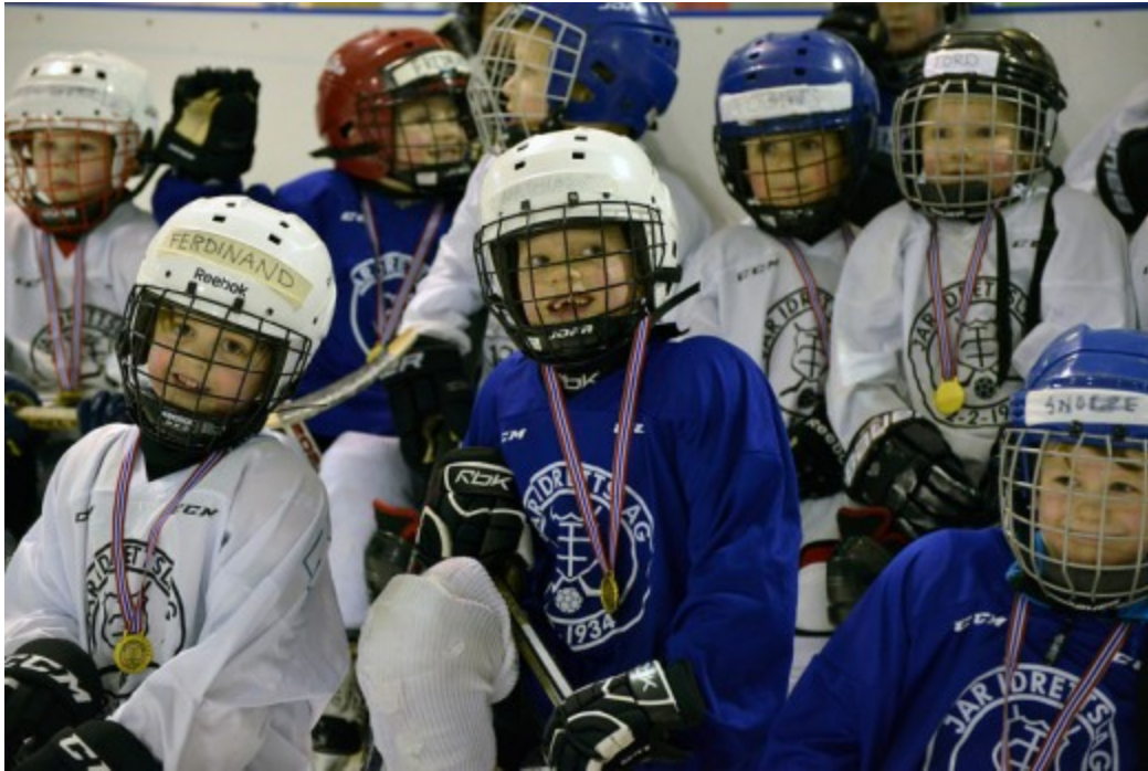
Skøyte- og ishockeyskolen deltok på turneringen - en stor dag også for de minste