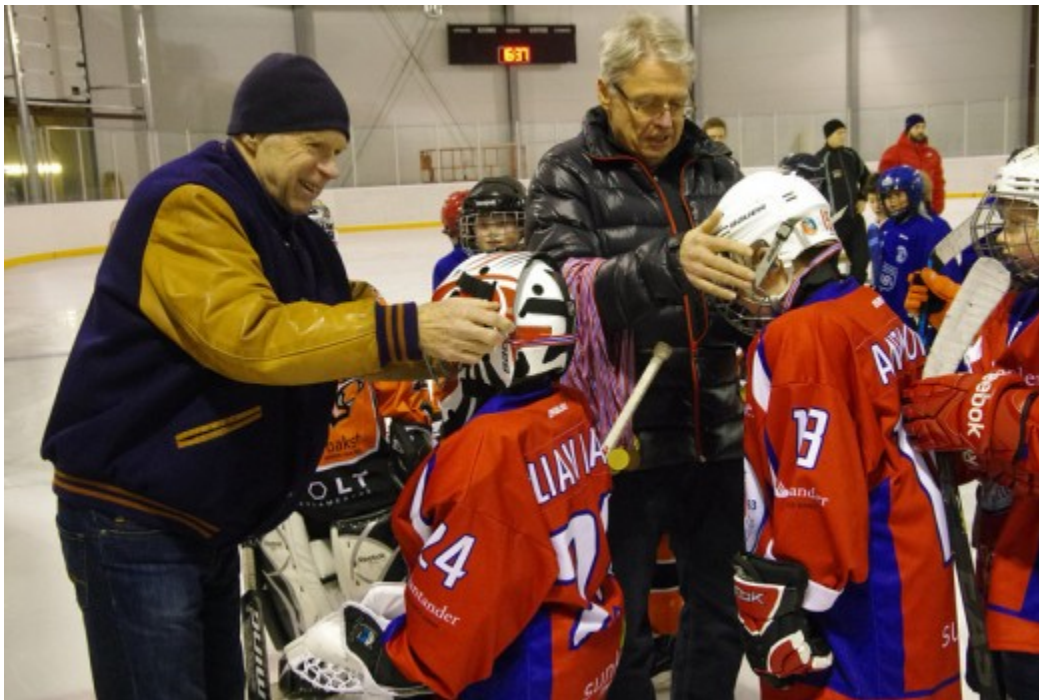
Brødrene Koren deler ut medaljer til deltakene lag og spillere